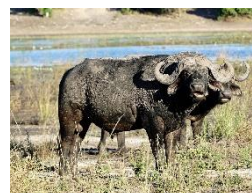
Chobe Nationalpark Wildbeobachtung sfahrt