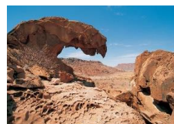
Twyfelfontein UNESCO Welterbe