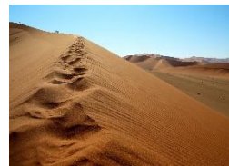
Sossusvlei Bis zu 300 m hohe Dünen