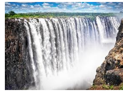
Viktoriafälle „Mosi-oa-Tunya“ der donnernde Rauch