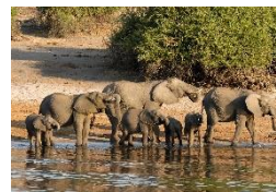
Etosha Nationalpark Wildnis aus nächster Nähe