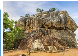
Sigiriya Die ehemalige königliche Zitadelle