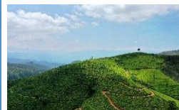
Nuwara Eliya Malerische Teeplantagen und Besuch einer Teefabrik