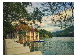
Kandy Die Hauptstadt der Berge am schönen See