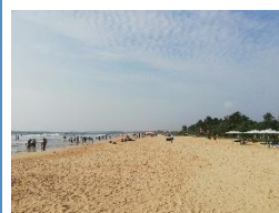
Bentota Der beliebte Strand nahe Colombo