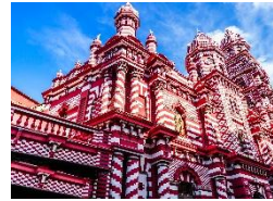
Colombo Sri Lankas Hauptstadt