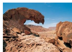
Twyfelfontein UNESCO Welterbe