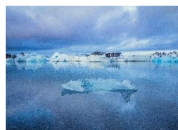
Jökulsárlón Gletscherlagune mit schwimmenden Eisgebilden