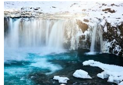
Goðafoss Der Wasserfall der Götter