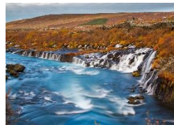
Hraunfossar Malerische Wasserfälle in grüner Umgebung