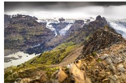
Skaftafell Nationalpark Gletscher und Wasserfälle