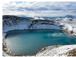
Mývatn See Inmitten einer vulkanischen Landschaft